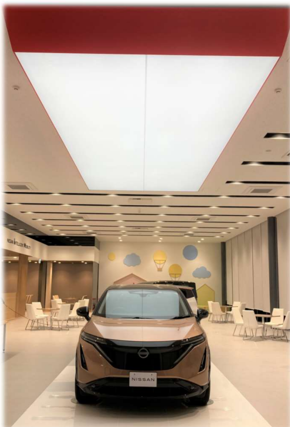
ニッサンドライブ

富山東店は、お気軽に足を運んでいただけるようなお店作りを強化推進するとともに、ご購入後のご相談やメンテナンス・車検・オイル交換などの充実したアフターサービスを提供し、地域のお客様のカーライフ拠点となれることを目指している。